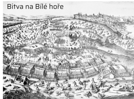
Bitva na Bílé hoře

6) Na úplný závěr si dovoluji vyjádřit se k počáteckému rodáku Tomáši Pešinovi. Ten, jako katolický kněz, schvaloval rekatolizaci, ale současně se ve svém důsledku vymezoval proti germanizaci. Ta sice do jisté míry začala se „zimním králem“, který se s českým prostředím neslil a na dvoře se užívala němčina, ale v plném rozsahu se projevila až po schválení Obnoveného zřízení zemského. Pešina žádal, aby se v jazykově smíšených oblastech používal při bohoslužbách střídavě český a německý jazyk.