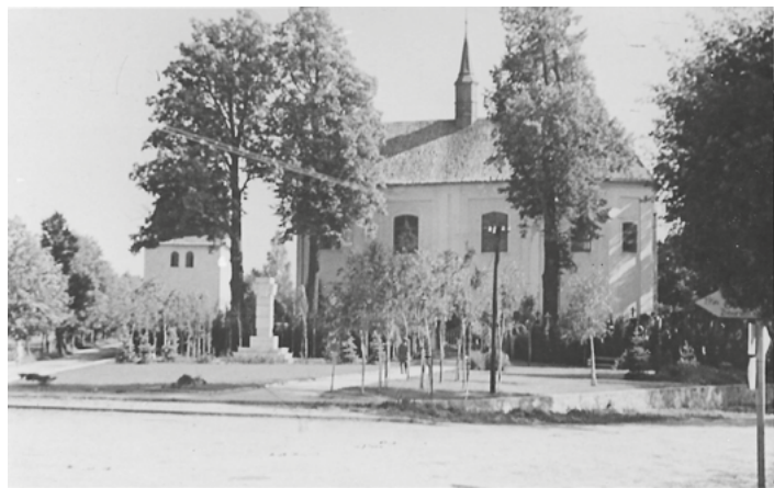
Upravený park před hřbitovem