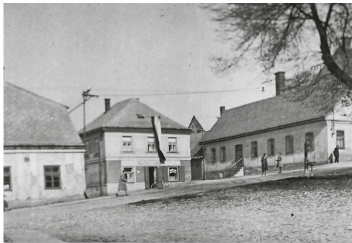
Fučíkovo náměstí ještě bez zeleně