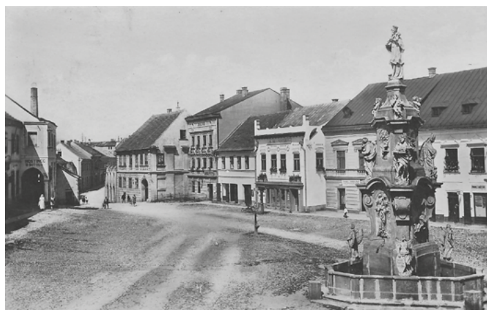
Palackého náměstí bez zeleně 1943